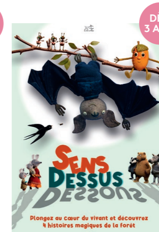
SENS DESSUS DESSOUS