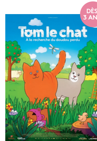
TOM LE CHAT - À LA RECHERCHE DU DOUDOU PERDU