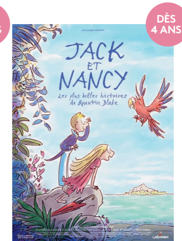
JACK ET NANCY - LES PLUS BELLES HISTOIRES DE QUENTIN BLAKE