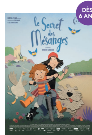
LE SECRET DES MÉSANGES