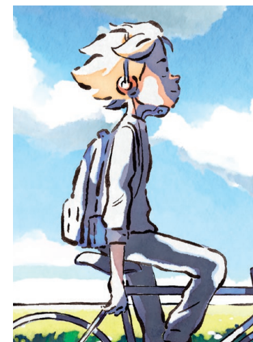
LE CORSET À partir de 7 ans