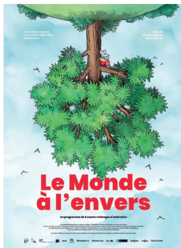
LE MONDE À L'ENVERS À partir de 4 ans