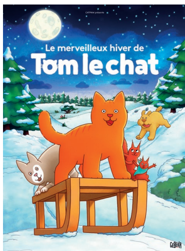
LE MERVEILLEUX HIVER DE TOM LE CHAT À partir de 3 ans