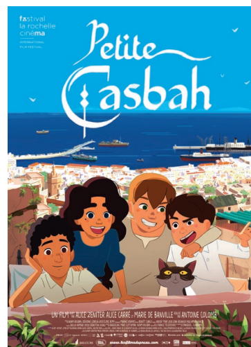
PETITE CASBAH À partir de 6 ans