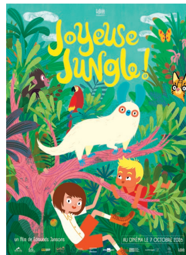
JOYEUSE JUNGLE ! À partir de 6 ans