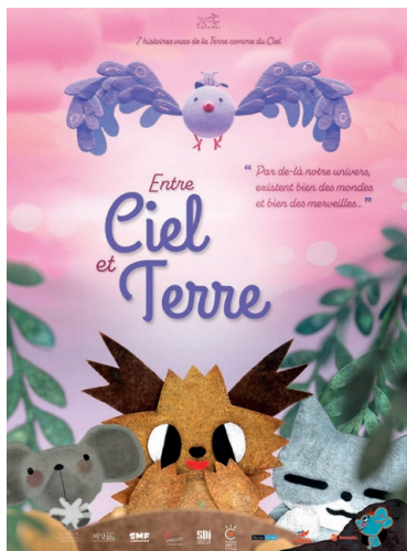
ENTRE CIEL ET TERRE À partir de 3 ans